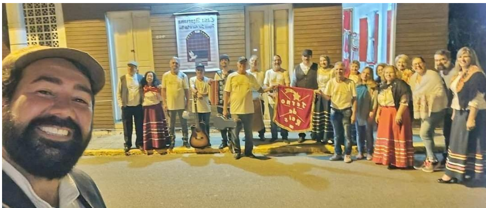
No dia 07 de novembro de 2021, recebemos na Casa Açoriana Villa Nova o Prefeito Emerson Stein, Prefeito de Porto Belo, juntamente com a Presidente da Fundação de Cultura, Cristiani de Jesus e demais integrantes da comitiva municipal de Porto Belo SC.