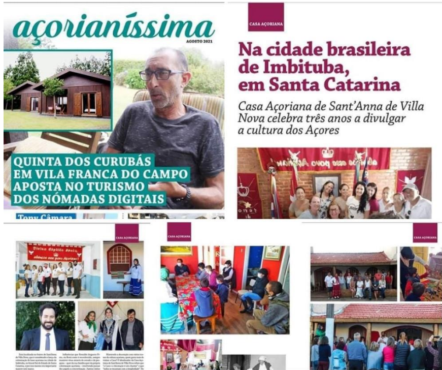
No dia 25 de setembro de 2021, sábado em Ação Cultural na Praça de Vila Nova!!