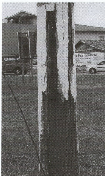
Rua Pedro Bittencourt (próximo ao Sacolão de Frutas e Verduras), Vila Nova - Imbituba.