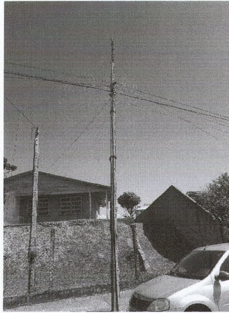
Av. Presidente Vargas, centro - Imbituba.

Solicito cópia desta indicação para a Celesc regional de Tubarão e para a Agência Nacional de Energia Elétrica (ANEEL).