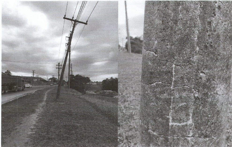
Trevo da Manuchar, sentido Divinéia - Imbituba.