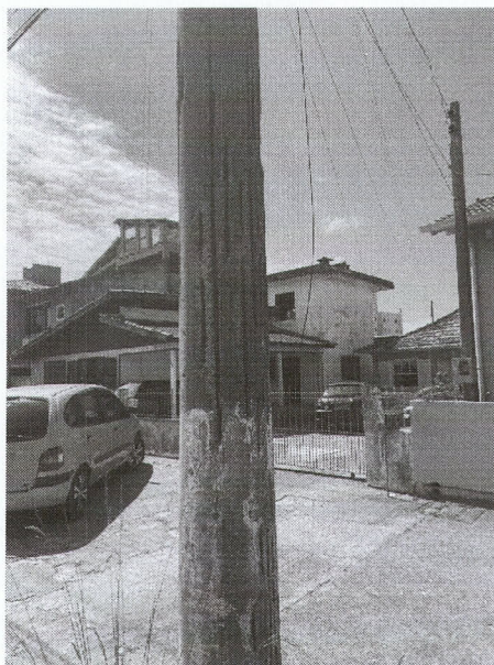
Av. Brasil (em frente à rua R.Cento e Sessenta e Sete), Paes Leme - Imbituba.