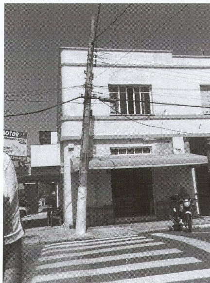
Rua Ernâni Cotrim - esquina com João Rimsa, centro - Imbituba.